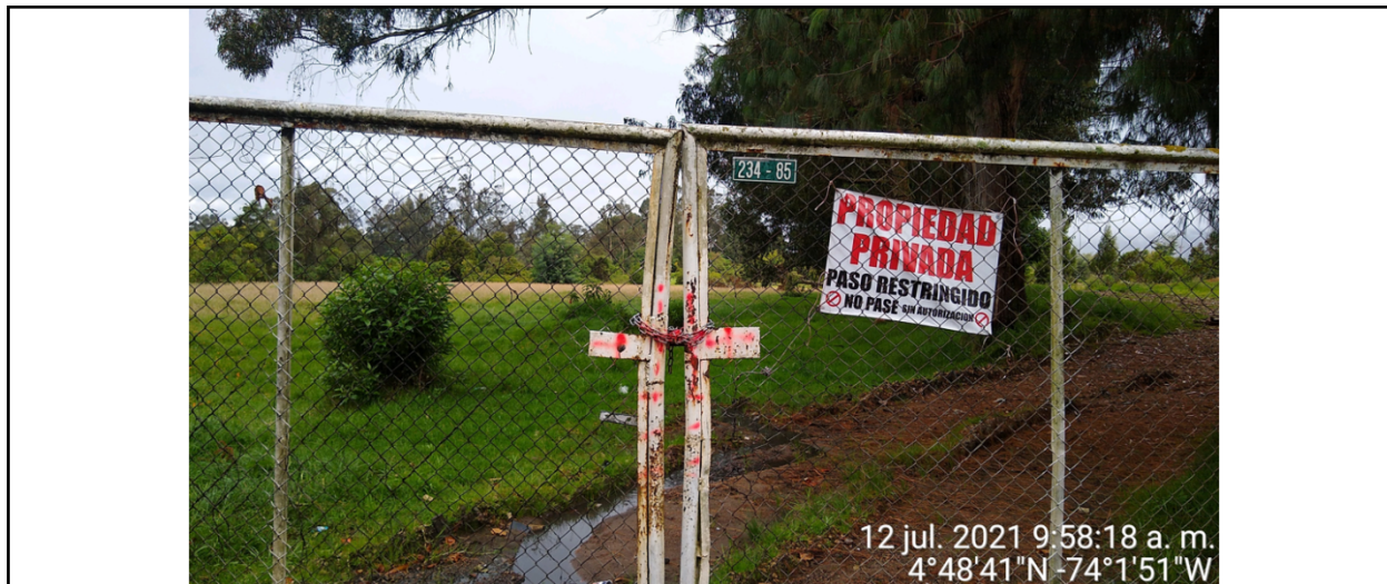
Fotografía No. 1 Predio ubicado en la AK 7 No. 234-85