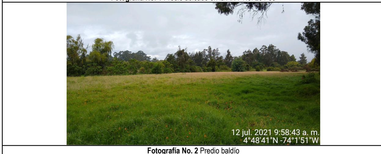
Fotografía No. 2 Predio baldío