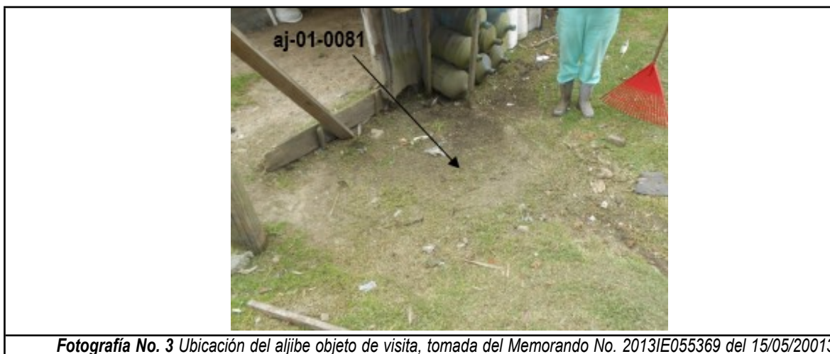
Fotografía No. 3 Ubicación del aljibe objeto de visita, tomada del Memorando No. 20131E055369 del 15/05/20013