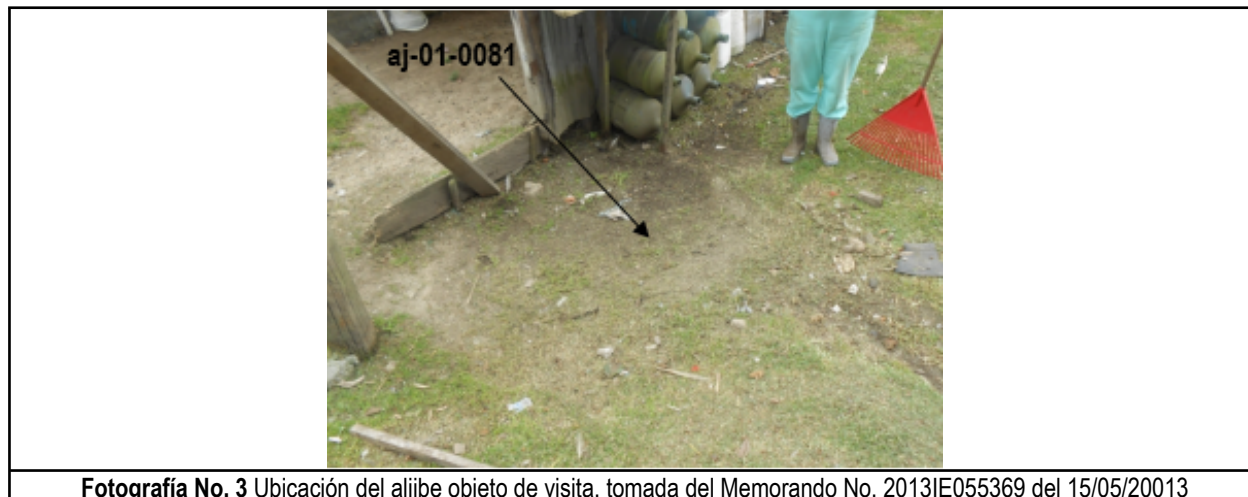
Fotografía No. 3 Ubicación del aljibe objeto de visita, tomada del Memorando No. 2013IE055369 del 15/05/20013