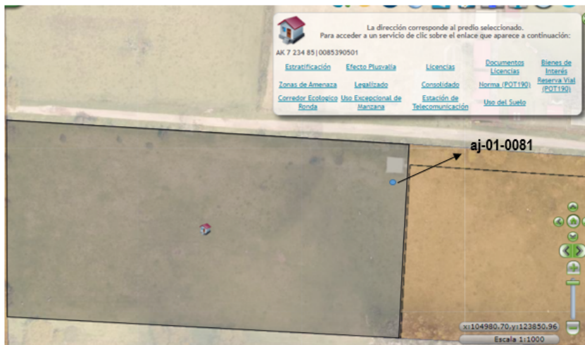
Imagen No. 2 Ubicación del aljibe aj-01-0081 en el predio identificado con chip AAA0144MAUH