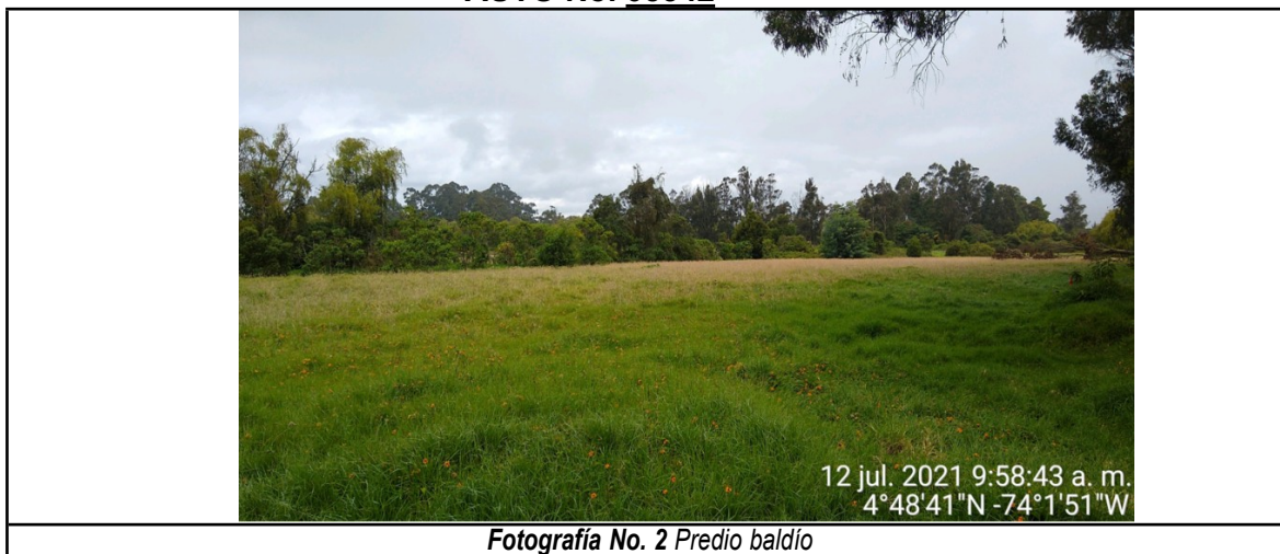
Fotografía No. 2 Predio baldío